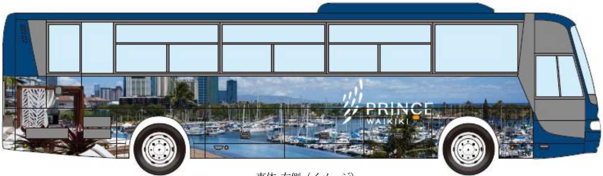
車体 右側 (イメージ)

(2) 後面：プリンス ワイキキのロビー天井に展示されている、『フラリ・イ・カ・ラ』という作品をラッピングしています。『フラリ・イ・カ・ラ』は、当ホテルが建つ場所にかつて流れていた小川で育った魚（ヒナナ）を表現しており、ハワイで高く評価されているアーティスト、カイリ・チュン氏により創作されたものです。