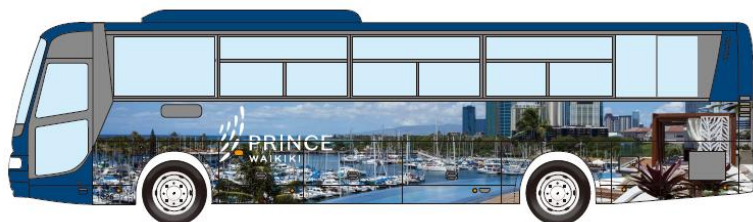
ラッピングバス 外観（イメージ）