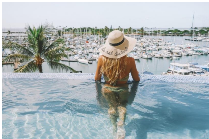
フォトジェニックなプリンス ワイキキのインフィニティープール