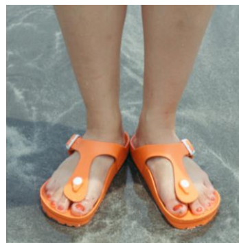
水にも大丈夫 EVA素材の“ギゼ”