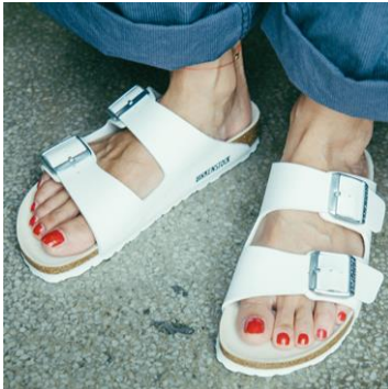
定番アイテム“アリゾナ”