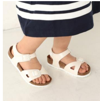
キッズサイズも豊富に取り揃えております