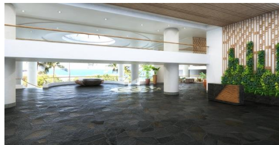
グリーンウォール（写真右端部分）