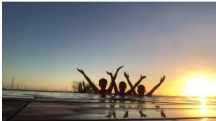
インフィニティプール