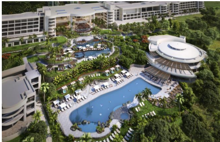
ウェスティン ハプナ ビーチ リゾート空撮パース

マウナケアリゾートにおいて、改装及びリブランドする「ウェスティン ハプナ ビーチ リゾート」でも、お客さまに支持されるホテルを目指してまいります。