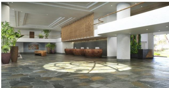
改装後のロビー（イメージ）

さらに、ロビーでひとときわ目を引き、お客さまをお迎えする垂直ガーデン（グリーンウォール）や、追加された温かみのある木製家具など、ホテルの特徴を洗練された装飾で表現します。