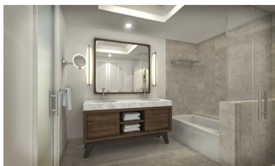
バスルーム（イメージ）