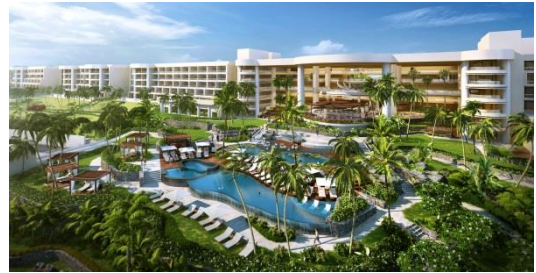
ホテル全景（イメージ）

ハプナとはハワイ語で「Ha」＝（息吹、命）と「Puna」＝（湧き水、場所）という意义があります。永遠の繋がりと再生を象徴するハプナの地で、休息と再生のやすらぎ体験で癒しを与えます。