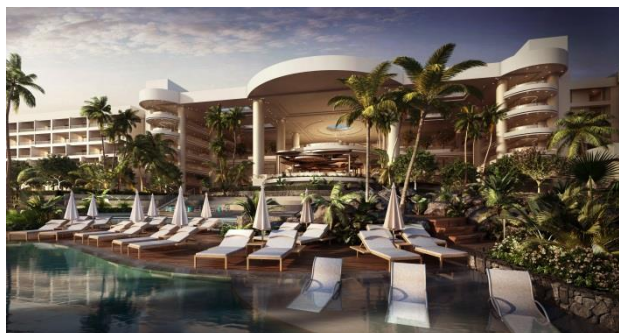
改装後のプール（イメージ）