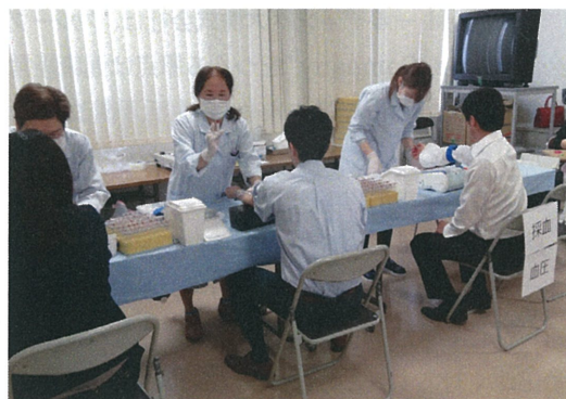
社内実施の健診の様子

経営トップが健康づくりの重要性を全社員に発信し、社員一人ひとりに向き合いメンタルケアに携わるなど積極的に関与。産業医や保健師と連携した施策実行に加え、次年度からは健保組合との連携体制強化を目指しています。全社員参加による取り組みを展開するほか、健診や専門スタッフによる健康相談の充実化にも力を入れています。