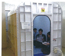
就業中に酸素BOXを利用し、いつでもリラックスできる環境を整備

経営トップらが社員一人ひとりに個別対応する質問会を定期的開催。業務上の困りごとや家庭での悩みの解決に時間をかけて向き合い、従業員の精神的なケアにつなげている。