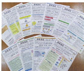
健康に関連する資料の全社回覧「健康通信」