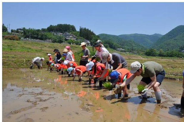
5月講座 農業体験①田植えに挑戦