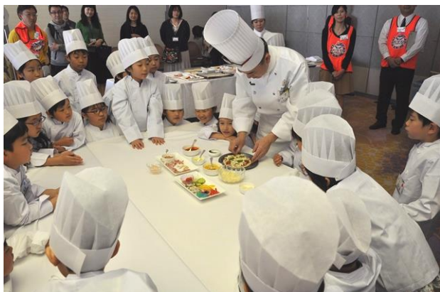
4月講座 ホテルのお仕事体験

「西武塾」は、当社グループ各社の社員が、経営理念でもあり社員の行動指針でもあるグループビジョンに基づいて、アイデアを経営層に提言する施策「ほほえみFactory」から生まれたものです。今後も当社グループでは、グループスローガン「でかける人を、ほほえむ人へ。」のもと、お子さまの健やかな成長を応援してまいります。