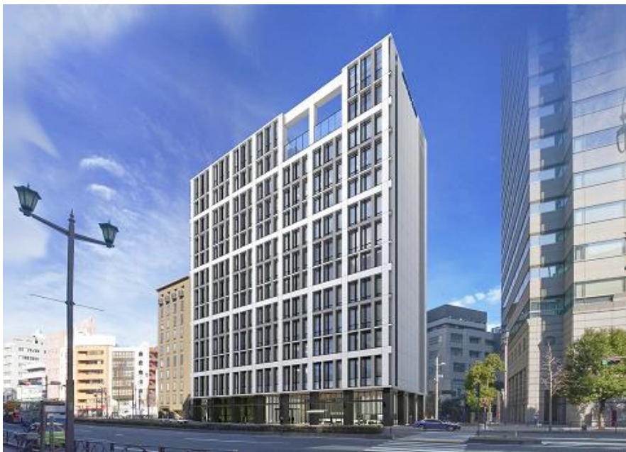
外観（麴町駅方面から）