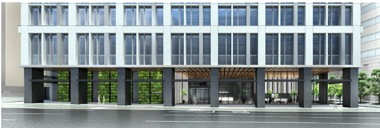
1階エントランスホール②