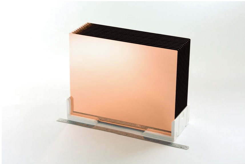
写真1 「HRDP ® 」表面外観写真

その特徴は、高い平坦性を有するガラスキャリア上に形成された極薄の「メッキ用シード層」によって超微細な RDL ※3 をパネルサイズ（例 600×600 mm）で形成でき、また「剥離機能層」によって260°Cの熱負荷後でも安定な機械的ガラスキャリアの取り外しが可能になります。