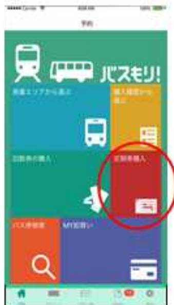
②定期券購入を選択