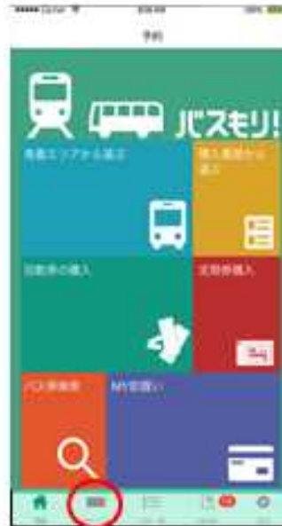
⑤メニューの“チケット”から 定期券を表示して乗車