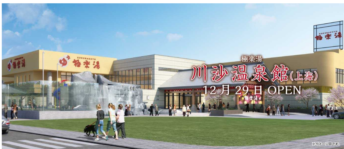
< 外観イメージ図 >

「極楽湯 川沙温泉館」は、「上海ディズニーランド」や「上海浦東国際空港」からも近く、これから発展が期待される地域に位置しています。また、中国現地企業とのパートナーシップ(FC形式)による2店舗目となります。