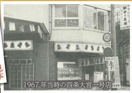
1967年当時の四条大宮一号店