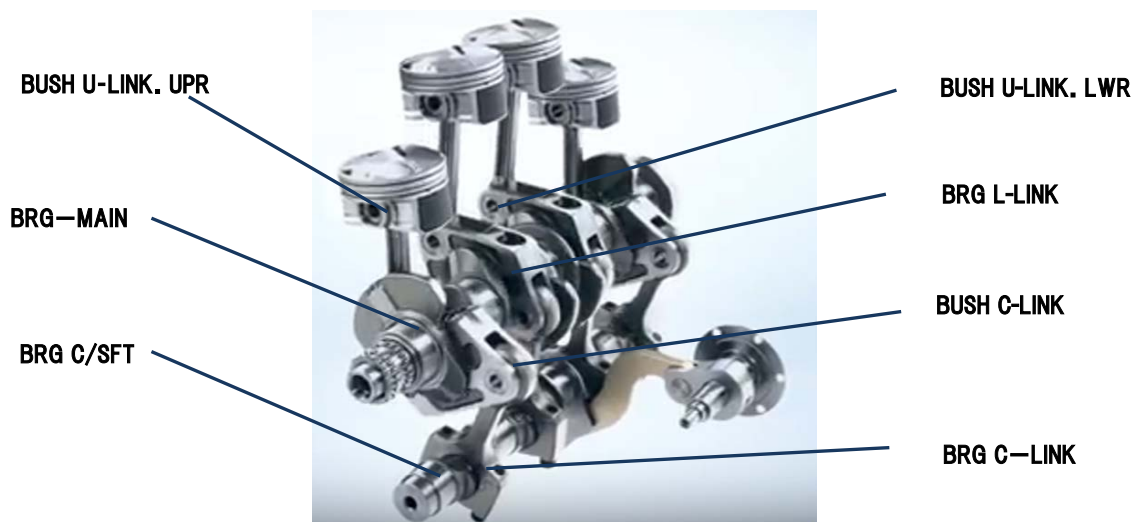
図2. 軸受の使用箇所

また、VC-T エンジンに使用される軸受の個数は、VCR 技術を持たない既存の同クラスエンジン（2L、直列4気筒）に比べ2 倍以上であり、月産約100 万個にもなることが見込まれます。