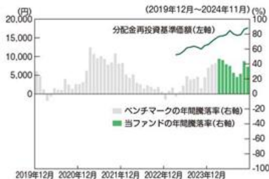
ファンドの年間騰落率及び分配金再投資基準価額の推移