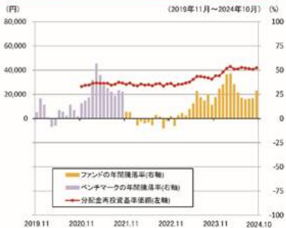
ファンドの年間騰落率と分配金再投資基準価額の推移