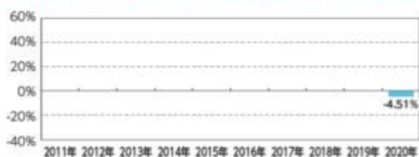
BNPパリバ・ターゲットリターン・ファンド(年4回決算型)