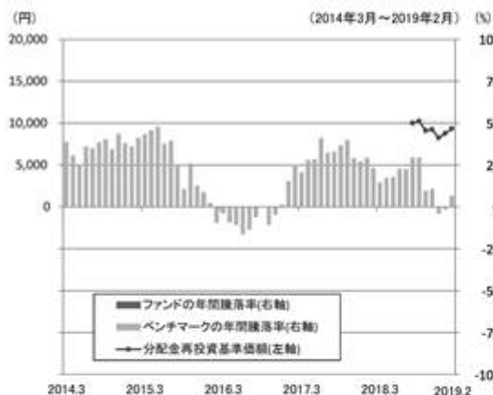
ファンドの年間騰落率と分配金再投資基準価額の推移