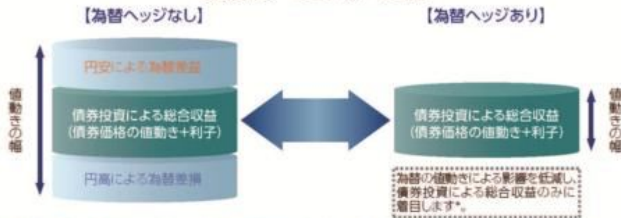
&lt;投資リターンのイメージ図&gt;

*為替ヘッジを行うにあたっては、対象通貨間の金利差に基づくヘッジコストが別途かかります。ただし、為替市場の状況によっては、金利差相当分以上のヘッジコストとなる場合があります。また、為替ヘッジにより、為替変動リスクを完全に排除できるものではありません。