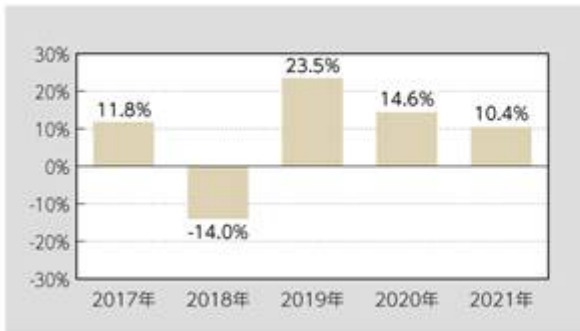
米ドル建て受益証券