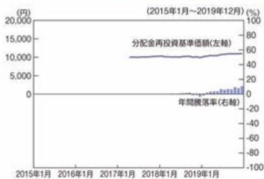
ファンドの年間騰落率及び分配金再投資基準価額の推移