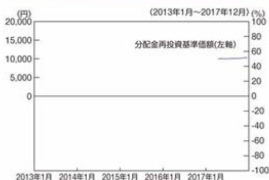
ファンドの年間騰落率及び分配金再投資基準価額の推移