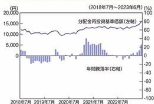
ファンドの年間騰落率及び分配金再投資基準価額の推移