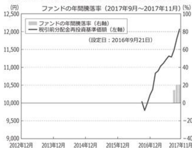
<ファンドの年間騰落率および分配金再投資基準価額の推移>