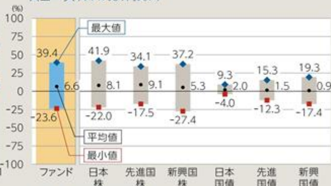
ファンドと他の代表的な資産クラスとの騰落率の比較 Aコース(米ドル売り円買い)