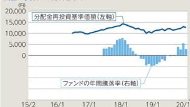
ファンドの年間騰落率及び分配金再投資基準価額の推移 Aコース(米ドル売り円買い)