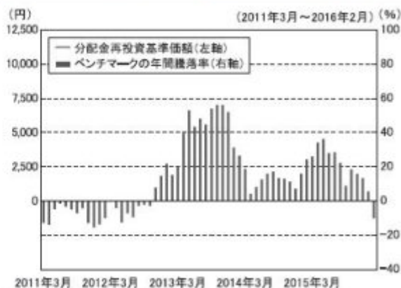
当ファンドの年間騰落率および分配金再投資基準価額の推移