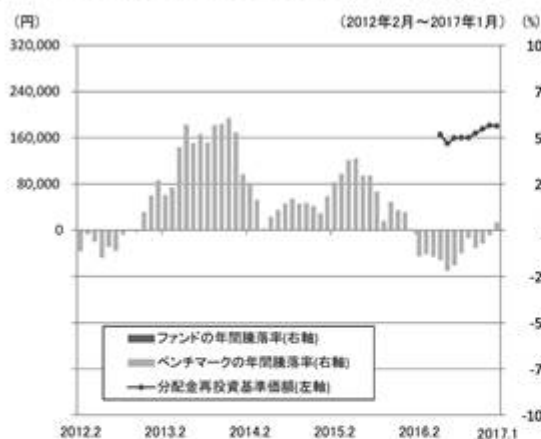
ファンドの年間騰落率と分配金再投資基準価額の推移