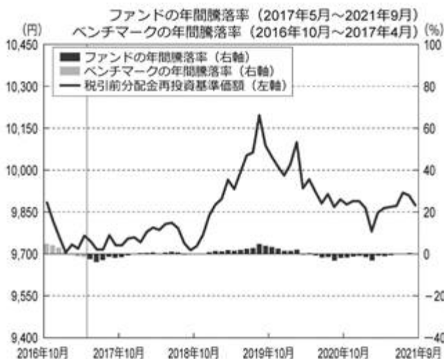
<ファンドの年間騰落率および分配金再投資基準価額の推移>