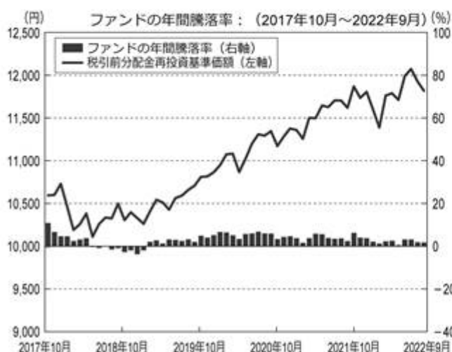
< ファンドの年間騰落率および分配金再投資基準価額の推移 >