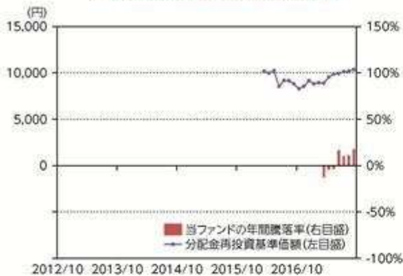
当ファンドの年間騰落率及び 分配金再投資基準価額の推移

*当ファンドの年間騰落率は、税引前の分配金を再投資したものとみなして計算した年間騰落率が記載されていますので、実際の基準価額に基づいて計算した年間騰落率とは異なる場合があります。