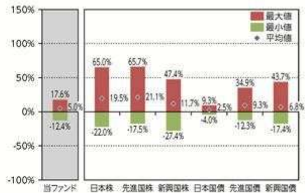
当ファンドと他の代表的な 資産クラスとの騰落率の比較

*当ファンドについては2017年3月～2017年9月の7ヶ月間、他の代表的な資産クラスについては2012年10月～2017年9月の5年間の各月末における直近1年間の騰落率の平均・最大・最小を表示し、当ファンドと他の代表的な資産クラスを定量的に比較できるように作成したものです。他の代表的な資産クラス全てが当ファンドの投資対象とは限りません。