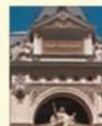
パリにあるBNPパリバ・アセットマネジメントの本社ビル

(出所)BNPパリバ インベストメント・パートナーズ株式会社のデータを基に三井住友トラスト・アセットマネジメント作成