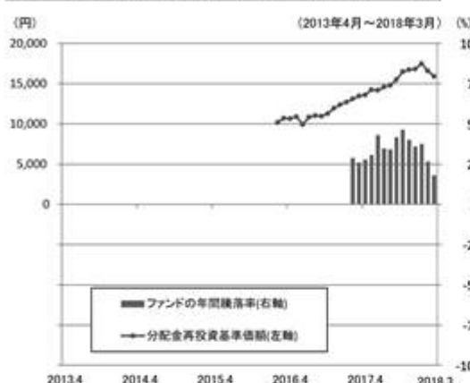
ファンドの年間騰落率と分配金再投資基準価額の推移