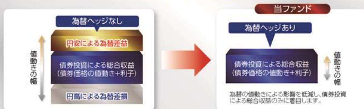
＜投資リターンのイメージ図＞

・上記は為替ヘッジを理解して頂くためのイメージ図であり、ファンドの将来の運用状況・成果等を示唆・保証するものではありません。