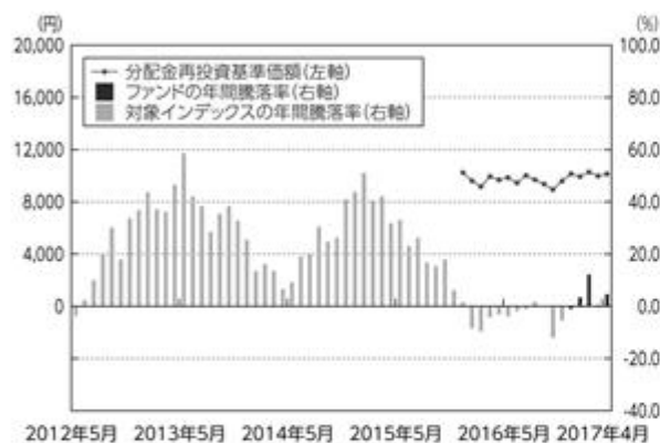
ファンドの年間騰落率および分配金再投資基準価額の推移