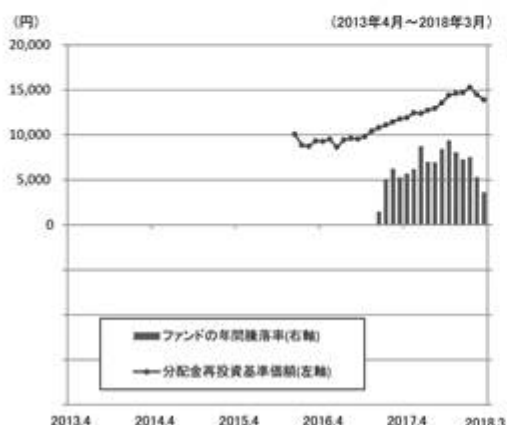
ファンドの年間騰落率と分配金再投資基準価額の推移