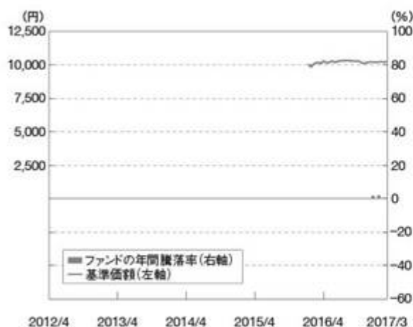
①ファンドの年間騰落率および基準価額の推移