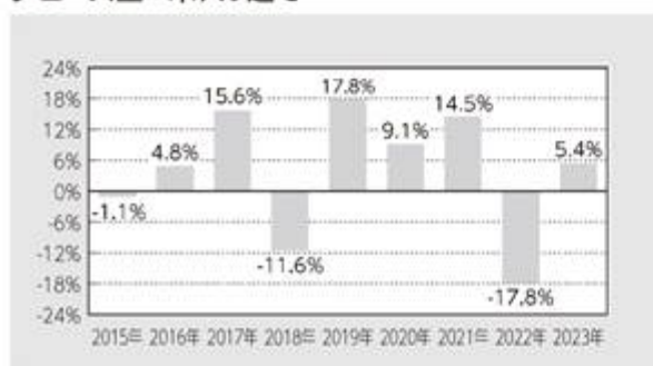
グロース型－米ドル建て