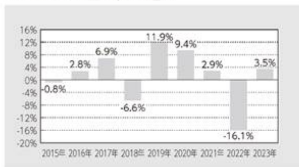
コンサパティブ型－米ドル建て