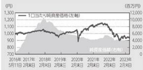
コンサバティブ型-円建て(ヘッジあり) (2016年5月11日(運用開始日)～2023年5月末日)