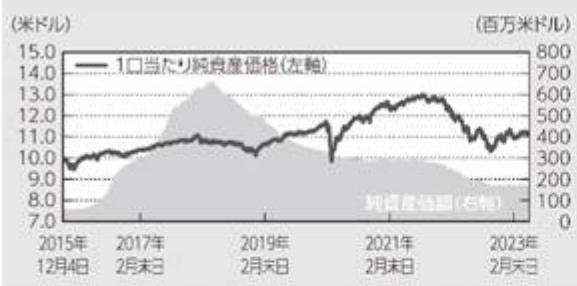
コンサバティブ型-米ドル建て (2015年12月4日(運用開始日)～2023年5月末日)