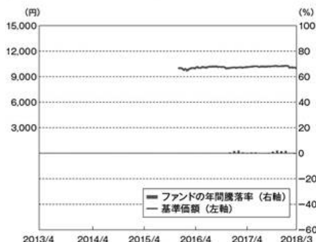
①ファンドの年間騰落率および基準価額の推移