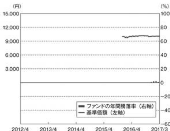
①ファンドの年間騰落率および基準価額の推移