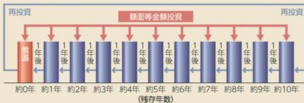
ラダー型運用のイメージ図