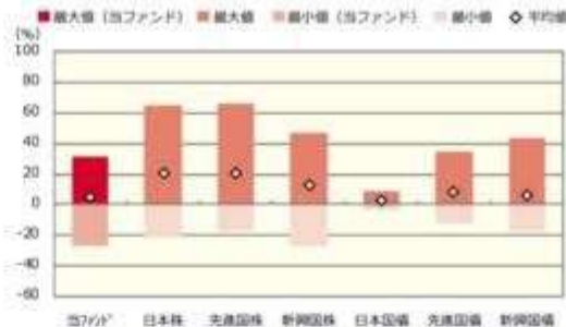
ファンドと代表的な資産クラスとの騰落率の比較

2013年3月 2014年2月 2015年2月 2016年2月 2017年2月 2018年2月