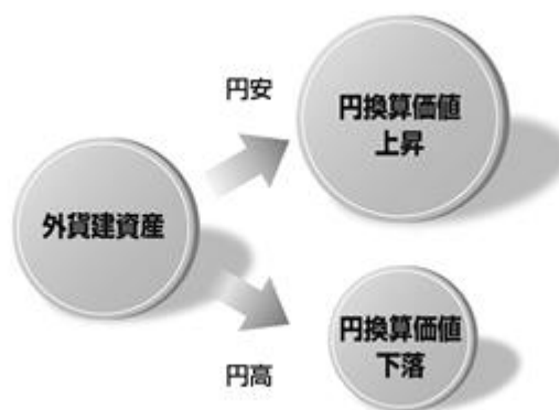
〈為替変動のイメージ図〉