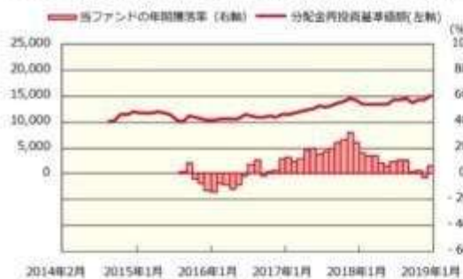
ファンドの年間騰落率および分配金再投資基準価額の推移