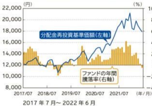
ファンドの年間騰落率及び 分配金再投資基準価額の推移