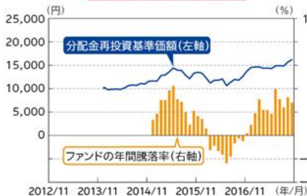
ファンドと他の代表的な資産クラスとの 年間騰落率の比較