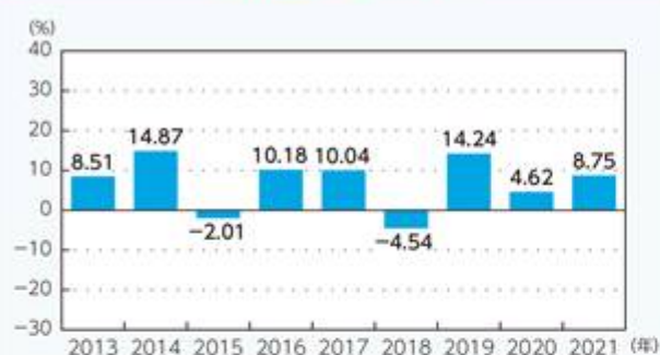
米ドル建 米ドルヘッジクラス