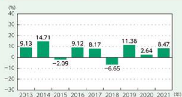
円建 円ヘッジクラス