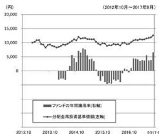
ファンドの年間騰落率と分配金再投資基準価額の推移