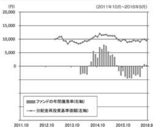
ファンドの年間騰落率と分配金再投資基準価額の推移