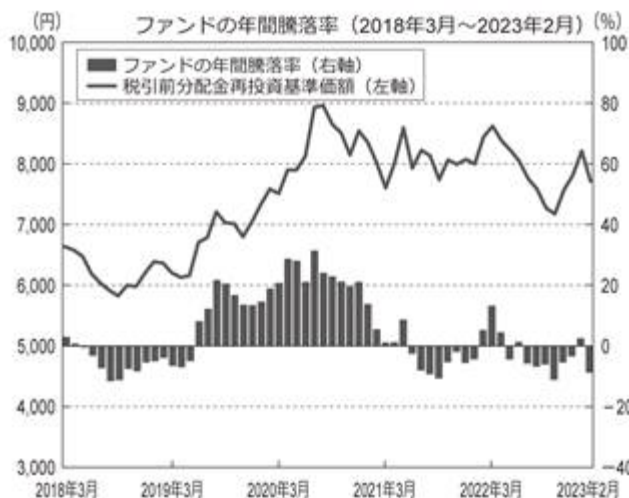
<ファンドの年間騰落率および分配金再投資基準価額の推移>