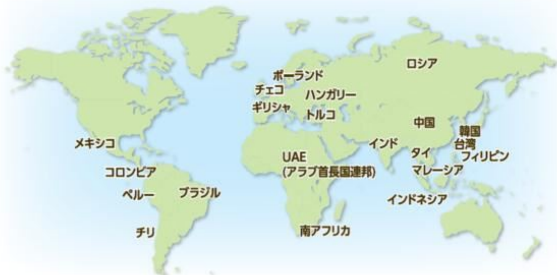
ラッセル新興国株インデックスの構成国・地域(2017年12月末現在)

※ 投資対象国・地域は、原則として年1回見直されます。上記すべての国・地域に投資するとは限りません。