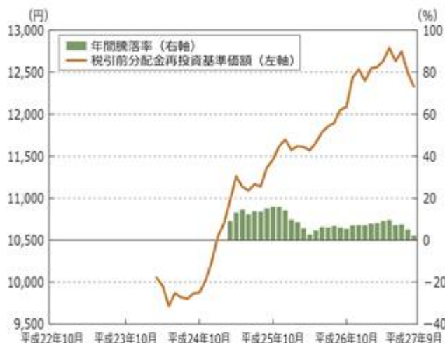
<ファンドの分配金再投資基準価額・年間騰落率の推移>