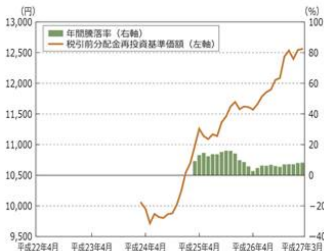
<ファンドの分配金再投資基準価額・年間騰落率の推移>