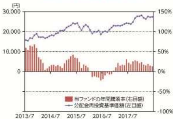
当ファンドの年間騰落率及び 分配金再投資基準価額の推移

*当ファンドの年間騰落率は、税引前の分配金を再投資したものとみなして計算した年間騰落率が記載されていますので、実際の基準価額に基づいて計算した年間騰落率とは異なる場合があります。