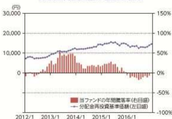
当ファンドの年間騰落率及び 分配金再投資基準価額の推移

*当ファンドの年間騰落率は、税引前の分配金を再投資したものとみなして計算した年間騰落率が記載されていますので、実際の基準価額に基づいて計算した年間騰落率とは異なる場合があります。