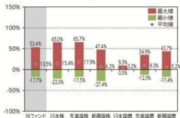
当ファンドと他の代表的な 資産クラスとの騰落率の比較

*2012年1月～2016年12月の5年間の各月末における直近1年間の騰落率の平均・最大・最小を、当ファンド及び他の代表的な資産クラスについて表示し、当ファンドと他の代表的な資産クラスを定量的に比較できるように作成したものです。他の代表的な資産クラス全てが当ファンドの投資対象とは限りません。