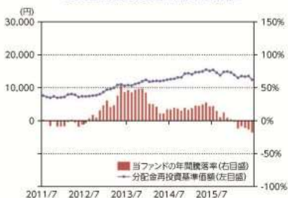
当ファンドの年間騰落率及び 分配金再投資基準価額の推移

*当ファンドの年間騰落率は、税引前の分配金を再投資したものとみなして計算した年間騰落率が記載されていますので、実際の基準価額に基づいて計算した年間騰落率とは異なる場合があります。